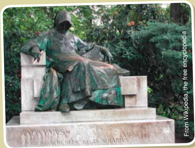
From Wikipedia, the free encyclopedia

Η ιδιότητα ή η κατάσταση του να παραμένεις άγνωστος ή μη αναγνωρίσιμος. 23